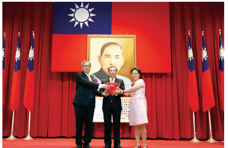
臺北分署分署長交接儀式

蔡部長肯定行政執行署各分署成立至今近 23 年，徵起金額已突破 6,400 億餘元，績效卓著。期許各位高階主管及分署長，應勇於承擔責任、以身作則，建立正確觀念，運用各種方法，使民眾瞭解遵守法律的重要性，保持積極態度，秉持「公義與關懷」核心價值，加強執行滯欠大戶。持續以創新思維與妥適應對作法，帶領同仁提升執行效率及服務品質，重視外界看法，回應各界要求，達成讓國人有感之施政目標。