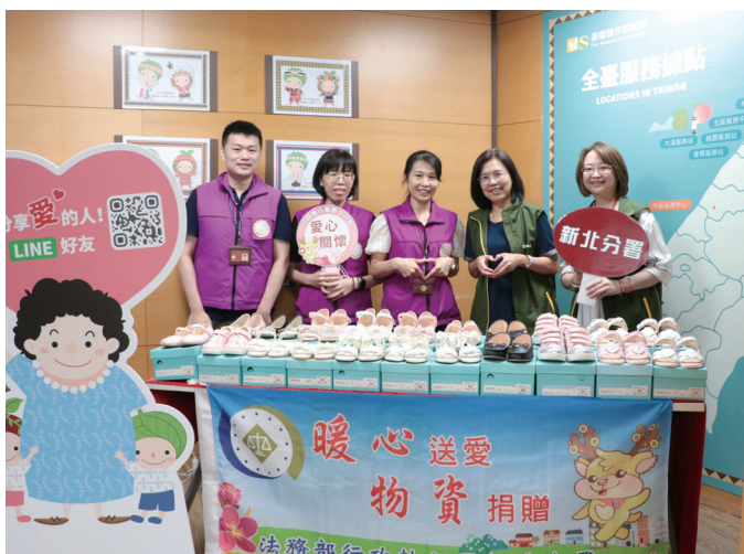
新北分署童鞋捐贈儀式

新北分署為推廣法拍專業知識，使民眾有機會瞭解法拍意義進而讓民眾對法拍產生興趣、祛除疑慮，勇於參與法拍，增加拍定機會，創造政府、義務人及民眾三贏的局面，於 112 年 8 月 24 日開辦本年度第 1 梯次「動產、不動產法拍官方免費教學」課程，吸引 59 位民眾報名。本次免費教學由主任行政執行官、行政執行官、書記官及執行員擔任講座及指導人員。為了讓學員親身體驗動產、不動產拍賣，更於現場舉辦模擬拍賣，由民眾實際參與演練。新北分署另定於 112 年 12 月 21 日下午 2 點，開辦第 2 梯次之法拍教學課程，持續推廣民眾法拍專業知識。