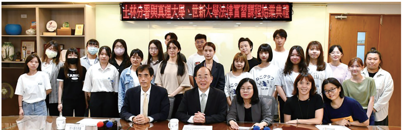
黃署長(中)親臨主持士林分署與真理大學、世新大學暑期法律實習課程始業式典禮。

士林分署並首次將虛擬實境 (VR) 技術，運用在動產與不動產現場查封及執行拘提課程中，讓執行過程真實完整呈現，使學員彷彿置身於現場，能身歷其境體驗查封及拘提程序，快速提升學習成效。士林分署更安排具有豐富執行經驗之同仁，採取分組指導方式，帶領學員研析有代表性之執行案例，以獲得最大實習效益。