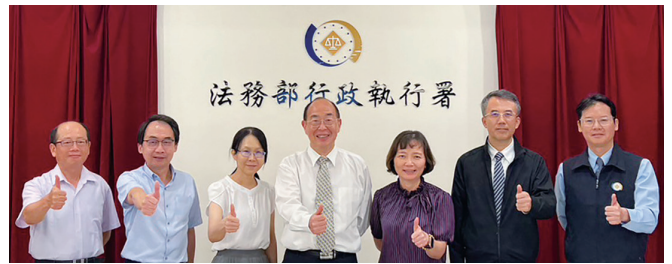
彰化地檢署張曉雯檢察長(右3)率同仁(左1至左3)至本署進行新建廳舍經驗分享。

關興建廳舍比起民間機構難度更高，鼓勵同仁不畏艱難努力堅持。張檢察長等人則分享興建廳舍時應注意事項，如慎選廠商、工程發包過程重點等。新竹分署則聚焦於現行興建過程中所遇到的難題，提出請益，並於會後建立雙方聯繫管道，便於日後交流。