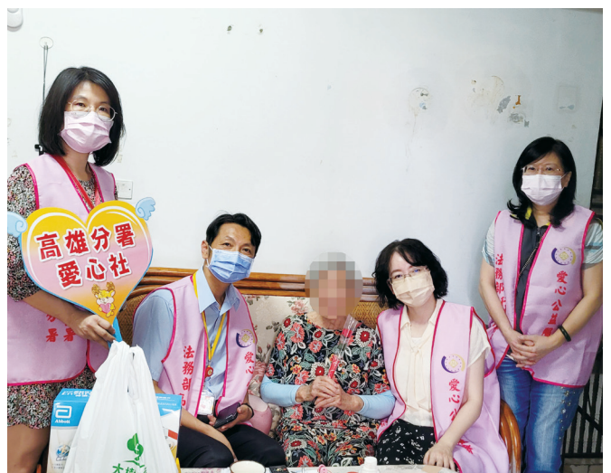
高雄分署愛心社致贈康乃馨與營養品

此舉讓執行體系的愛心與關懷不間斷地傳遞擴散，充分展現行政有愛公義無礙的執行理念。