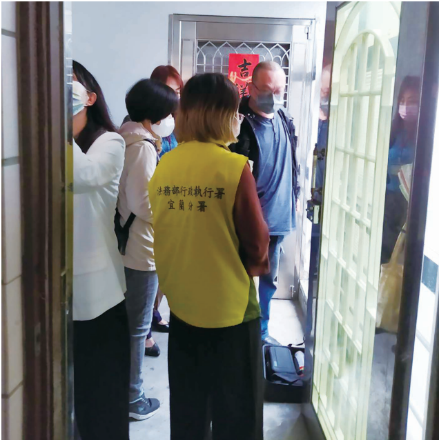
基隆空屋帶看服務

基隆市一名男子積欠稅款、健保費及罰鍰共 28 萬餘元，名下位於基隆市建物經宜蘭分署查