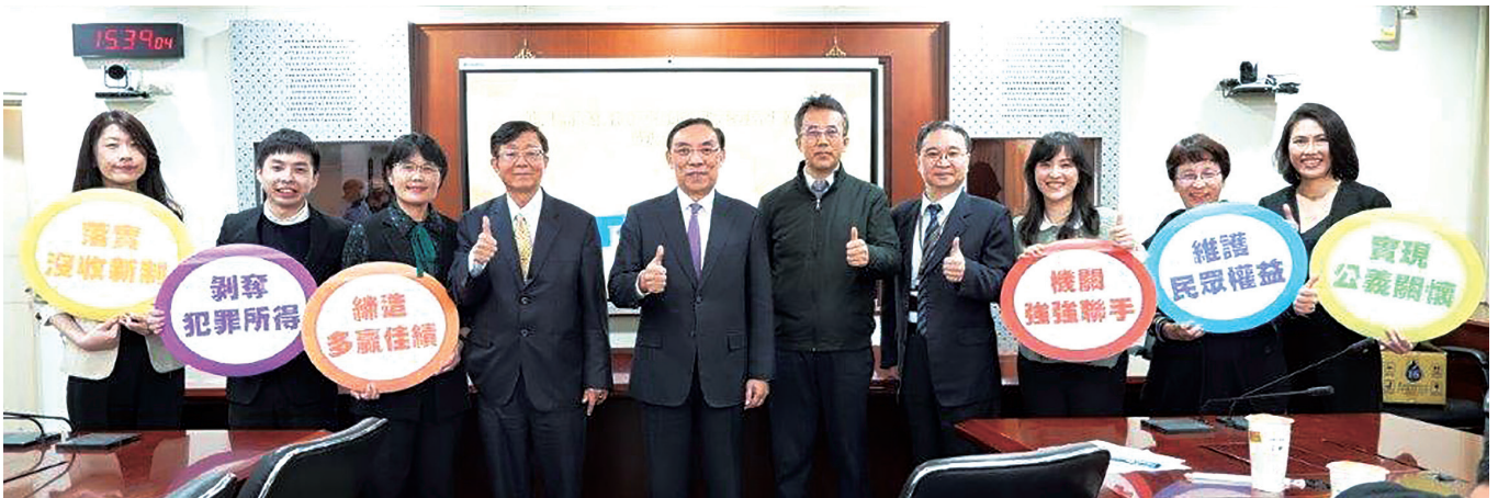
新竹分署於司法記者茶敘後發表「紅富海吸金案」犯罪不法所得變價成果

除此之外，本件苗栗地檢署囑託新竹分署變價雖僅有 3 案，但新竹分署總計拍賣、變賣金額竟高居檢察機關囑託執行之冠，甚至相關拍賣物件，在新竹分署善用巧思之推介下，其最終拍定金額高出底價甚多，溢價比屢創新高，其中最高之溢價比更高達 162.88%，打破「法拍即賤賣」之刻板印象，成果可謂卓著！