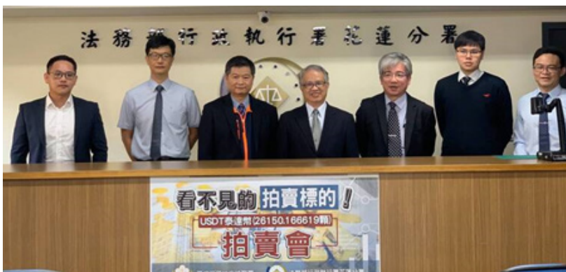
花蓮地檢署與花蓮分署聯合舉辦「看不見的拍賣標的」拍賣會

又臺灣士林地方檢察署偵辦「台版柬埔寨」詐騙集團案，囑託士林分署於今年5月間變價7萬3,432餘顆泰達幣，經過輪番加碼激烈競價後，最後以總價222萬1,000元順利拍定，為目前最大宗虛擬貨幣拍賣會。