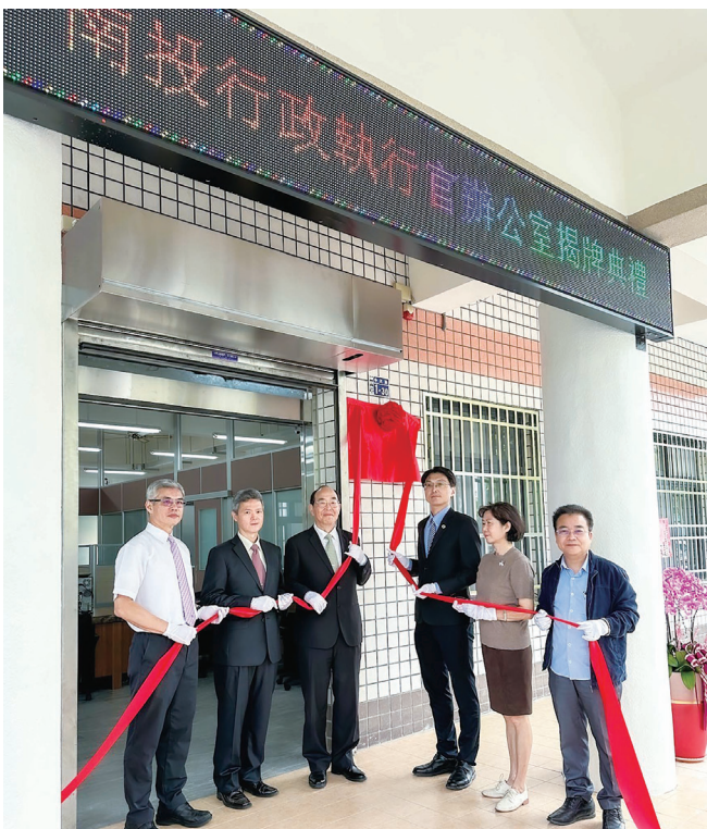
揭牌典禮由黃署長玉垣親臨主持

黃署長致詞時表示，南投是個好山好水、地靈人傑的好地方，非常適合上班與居住，而新的南投辦公室能在這麼好的地方成立，建築也俱有中西合璧特色，是中央與地方共同合作的成功典範，也是跨部會合作的超前部署，同時南投辦公室也有更方便、舒適的空間來服務民眾。