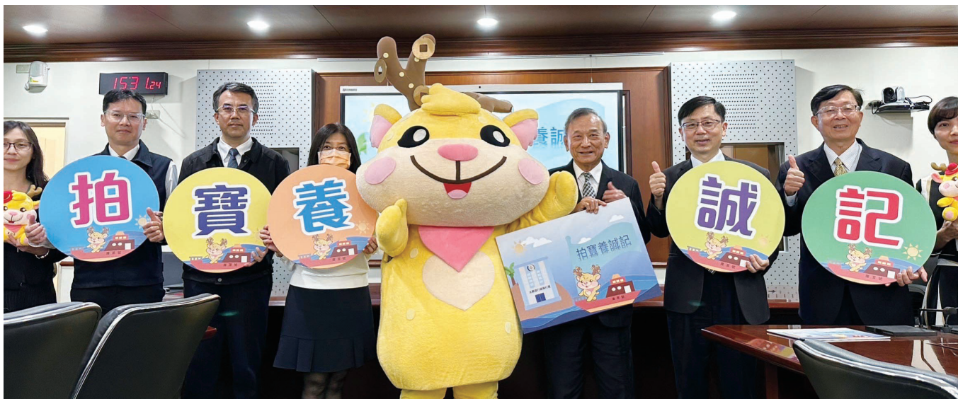
法務部陳政務次長明堂於「拍寶養誠記」發表會與大家合影

宣導活動由新北分署於 112 年 2 月全台首站開跑，後續高雄、臺中、士林及桃園等分署接力進行，而宜蘭、屏東、嘉義、臺北、花蓮及彰化等分署長亦帶隊深入在地國小，與學童進行面對面互動，並透過多元宣導內容之安排，藉由寓教於樂的活動與遊戲，將法令遵循及誠信廉潔等正確價值觀深植校園，讓品德教育變得輕鬆有趣，亦有學童在課後寫下學習心得，如「我覺得要誠實，因為誠實有很多機會，但不誠實就沒有機會」及「我很喜歡今天的故事」等語，宣導活動後校方以致贈感謝狀、臉書刊登活動花絮影片等方式以表感謝，顯見活動深獲學童及師長之肯定及讚賞，而有效將誠信理念潛移默化於學童心中。