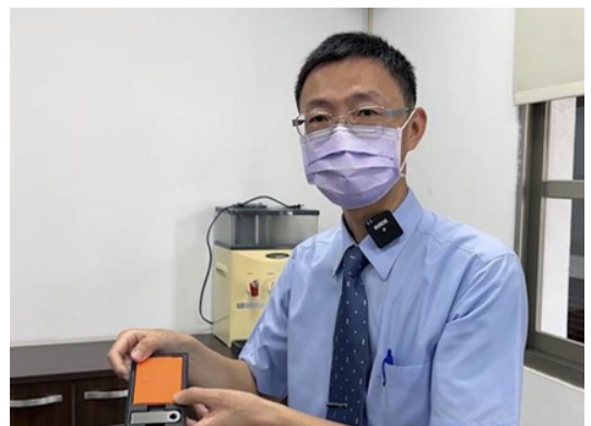
臺南分署展示俗稱的「冷錢包」