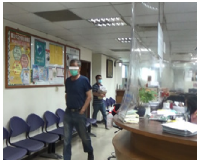
彰化分署向法院聲請管收陳姓負責人獲准

收後，家屬隨即委託律師來電詢問案情並表示願意代為處理欠稅，隔日以現金繳清全數欠款 418 萬餘元，成功徵起該案件。