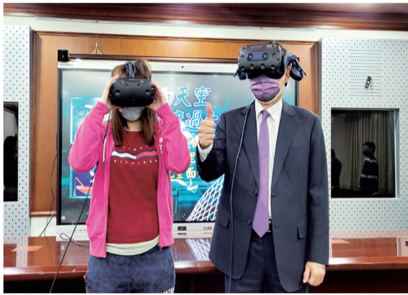
▲ 部長與記者現場穿戴 VR 裝備親覽抽砂船內部構造