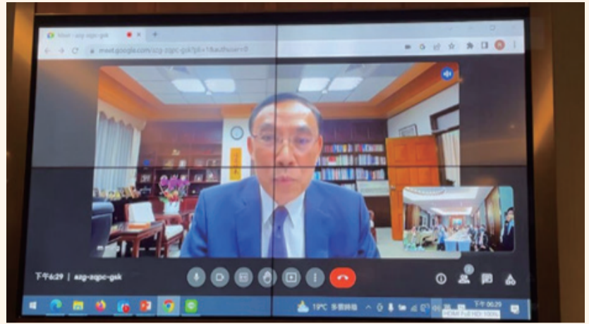
蔡部長以視訊方式給予本署暨各分署肯定與嘉許，並勉勵同仁推動執行業務之辛勞

本次會議蔡部長清祥因立法院審查預算不克前來，但仍撥冗採視訊方式表示，行政執行最終的目的是要培養民眾守法的觀念，並不只是追求數字、達成績效而已，而是要讓被迫繳罰款的義務人知道要守法，這就是法遵和法治教育的重要性。執行署執行時，也在協助關懷弱勢義務人，去 (111) 年底募得一筆款項，希望各位能夠及時交到需要關懷義務人手上，並代為轉達法務部與新光鋼鐵董事長關懷之意。另部長肯定執行署近來推動「虛擬帳號」繳款方式便利民眾繳款，以及運用遙控無人機空拍不動產、VR( 虛擬實境 ) 技術運用在法拍