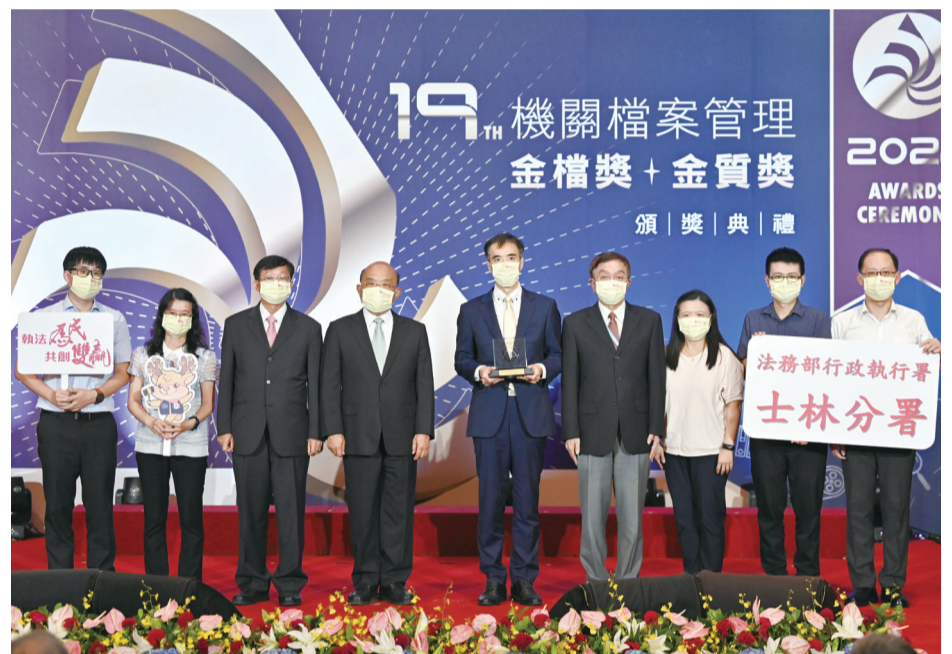
▲ 林署長慶宗親率士林分署同仁接受蘇院長貞昌頒發金檔獎獎座

繼士林分署榮獲第 19 屆機關檔案管理金檔獎，屏東分署亦將接棒參加第 21 屆機關檔案管理金檔獎評選。為了讓民眾了解該分署自 90 年 1 月 1 日成立，22 年來，機關廳舍如何從舊有看守所、少年觀護所舍房，華麗變身成今天充滿綠意盎然的廳舍演變過程，特於 111 年 10 月 5 日起至 11 月 9 日止，舉辦「新屏砌核檔案展」，針對 5 人以上團體預約參觀，安排