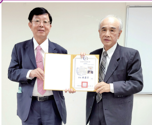
▲ 林署長慶宗與林前大法官錫堯合影

專人解說導覽，藉由實體文物與今昔照片說明，讓民眾感受屏東分署所承載的歷史記憶與環境生態之美。此外，屏東分署為方便無法親自到分署觀覽的民眾，另於官網舉辦線上檔案展，並率先運用元宇宙，民眾透過下載 GOXR 軟體或利用 VR 眼鏡觀賞線上檔案展，更有身歷其境的立體感。