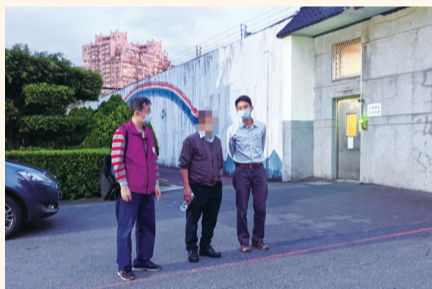
林男（中）進管收所前，執行人員曉諭其儘速繳清欠款或辦理分期繳納。

務人顯有履行義務之可能，故不履行，且有隱匿或處分應供執行財產之情事，當日向臺灣新北地方法院聲請管收 3 個月獲准。林男在管收所只待一夜即無法忍受，向執行人員表示可不可以只關一天就好，自己願盡最大力量償還，希望能儘速離開管收所，翌日經提詢出所後，便先行繳納現金 230 萬元，剩餘稅款辦理分期繳納，並供擔保後獲釋。